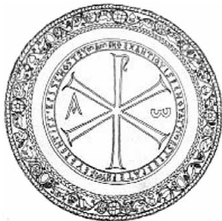
Discul episcopului Paternus (Barnea, 1944)

O serie de alte obiecte, între care menționăm ulcioare, fragmente ceramice, opaite, plumburi comerciale ș.a., toate purtând simboluri creștine indubitabile, se înscriu pe lista obiectelor descoperite în Dobrogea care atestă prezența comunităților de creștini aici în secolele IV-VI.