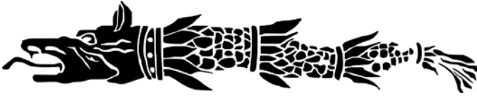
Stindard dacic

Regele Decebal a reușit să strângă o armată estimată la aproximativ 50.000 de oameni, cu care și-a așteptat inamicii la Tapae. Lupta dată aici a fost câștigată de romani, iar dacii s-au retras spre sistemul de fortificații din munți. În iarna din 101-102 dacii, aliați cu sarmații roxolani și probabil cu burii (de neam germanic), au provocat o diversiune, atacând teritoriul Sciției Mici și provocând o serie de pagube romanilor. Împăratul Traian a venit în Dobrogea și a reușit să-i învingă pe daci și pe aliații lor într-o bătălie purtată la Adamclisi. Mai târziu, biruitorul a marcat evenimentul prin ridicarea pe acel loc a monumentului numit Tropaeum Traiani. După acest episod de iarnă, luptele au continuat, cotropitorii îndreptându-se către capitala regatului dac. Când romanii au ajuns în fața Sarmizegetusei, după ce cuceriseră mai multe fortificații ale dacilor, Decebal s-a arătat dispus să încheie pace cu Traian, fiind gata să accepte condițiile învingătorului.