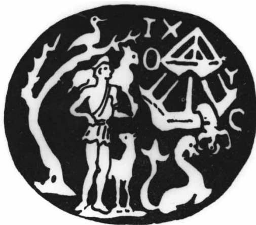
Gema de la Potaissa

La Turda (vechea Potaissa) a fost descoperită în jurul anilor 1830-1840 o gemă din onix, pe care era sculptată o complexă scenă a „Bunului Păstor”: Mântuitorul Hristos ținând un miel pe umeri și având un altul la picioare, un pom cu o pasăre (pomul vieții și porumbelul – simbol al Sfântului Duh), Iona căzând din corabie, iar dedesubt un monstru marin în așteptare și, în partea superioară, așezate după cum a permis spațiul liber, literele grecești IXΘΥΣ , al căror sens l-am arătat mai sus. În cursul mișcărilor revoluționare din anii 1848-1849 obiectul a dispărut, însă descrierea sa și reprezentări ale sale s-au păstrat, permițându-ne să-l cunoaștem și să-l interpretăm. Gema datează din secolul al IV-lea și nu este singulară în Transilvania.