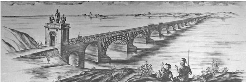
Macheta podului lui Traian de la Drobeta

În aceste condiții, izbucnirea unui al doilea război între Traian și Decebal era inevitabilă. Cel mai important indiciu al faptului că Traian plănuia să ducă lucrurile mai departe în ceea ce privește statutul Daciei este construirea, în anii 102-105, a unui pod de piatră peste Dunăre, la Drobeta. Lucrarea a fost încredințată arhitectului Apollodor din Damasc și era destinată înlesnirii transportului de trupe și de materiale peste fluviu.